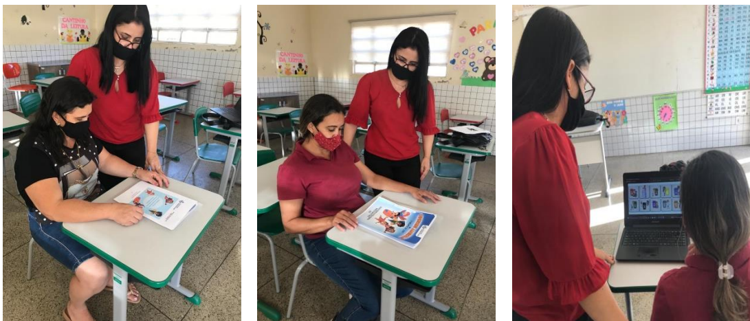
Fotografia 2- Professoras avaliando o produto educacional.

Primeiramente, foi apresentado o referencial teórico expondo aos professores os fundamentos filosóficos e pedagógicos da Pedagogia Histórico-Crítica segundo Galvão, Lavoura e Martins (2019) e Saviani (2019), compreendendo os cinco momentos dessa pedagogia não de forma normativa, prescritiva, expressa em passos lineares e mecânicos realizados de maneira sequencial, mas sim articulados e interdependentes.