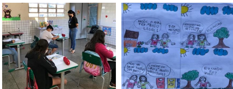
Figura 4: Realização de atividade da SD.

A experiência de aplicação da proposta foi realizada entre os dias dezesseis a dezoito de junho de dois mil e vinte um. Foram utilizadas cinco aulas, de cinquenta minutos cada, voltadas para turma do quinto ano da Escola Municipal Elói Alves da Fonseca, com a participação de todos os sete alunos da turma. Na primeira aula, os alunos responderam a perguntas para identificação dos conhecimentos prévios relacionados a histórias em quadrinhos e problemas ambientais. Na última aula, com base nos estudos e atividades realizadas nas quatro primeiras aulas, eles produziram uma HQ.