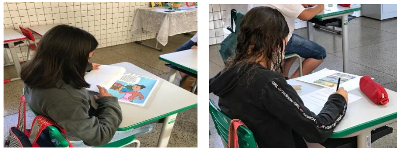
Figura 5: Momento de leitura de história em quadrinhos.