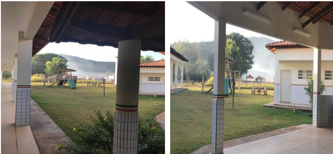
Figura 1- Fumaça causada pela queima de lixo no lixão próximo da escola.

Dentre as sugestões dos pedagogos entrevistados, propondo ações para a promoção da Educação Ambiental, tendo como foco o contexto local estava a necessidade de materiais didáticos que abordassem problemáticas relacionadas ao lixo, à escassez de água e à destruição do cerrado. Partindo dessas pontuações, deu-se a elaboração de material textual intitulado “Defensores ambientais em o desafio do lixo” que aborda questões enfrentadas pela comunidade escolar pesquisada em razão do lixão localizado nas proximidades da escola.