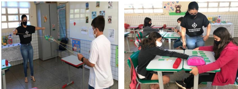
Figura 6: Brinquedo produzido por aluno feito com garrafa pet e aplicação do jogo da memória

ressignificados pelos estudantes permitindo assim a alteração em sua prática social a partir de uma nova maneira de pensar e de agir.