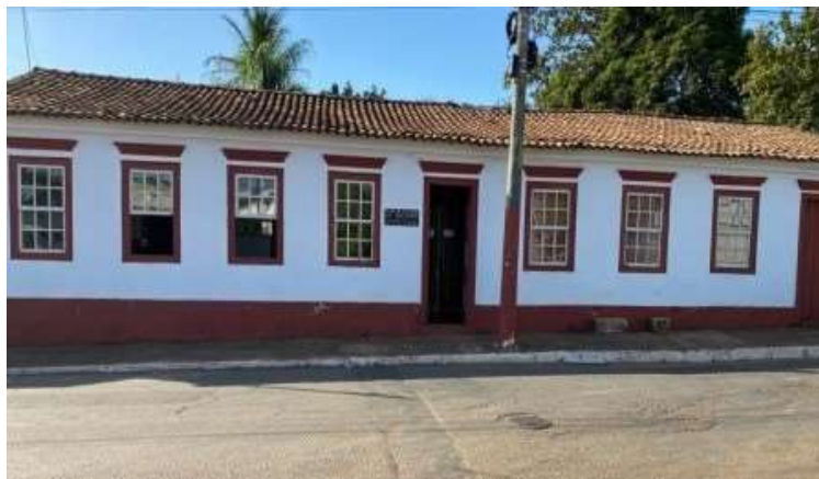
Museu Casa da Cultura Coronel João Elias da Silva Caldas – Itaberaí-GO