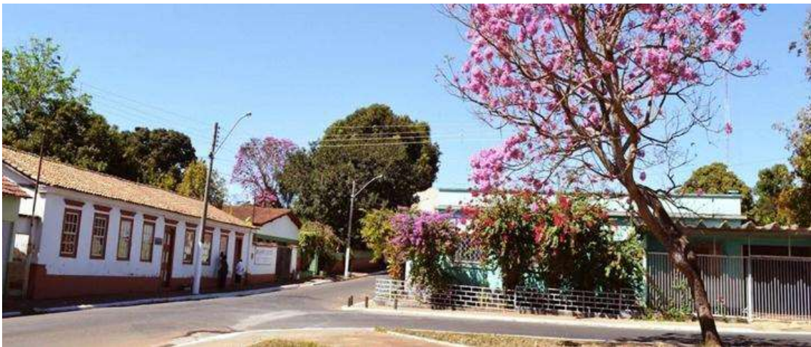
Museu Casa da Cultura Coronel João Elias da Silva Caldas – Itaberaí-GO