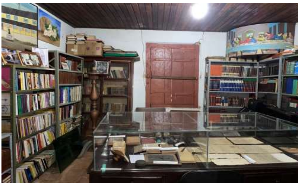
Exposição de objetos escolares de antigamente – Museu Casa da Cultura